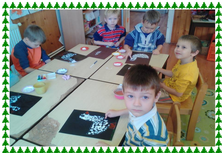
Mártonnap az oviban